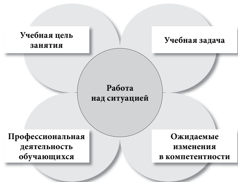
Рис. 2. Смысловое поле работы над учебной ситуацией

Работа с учебной ситуацией может быть организована по различным схемам или алгоритмам. Наиболее распространенной схемой работы обучающихся над сюжетом текста является следующая последовательность шагов.